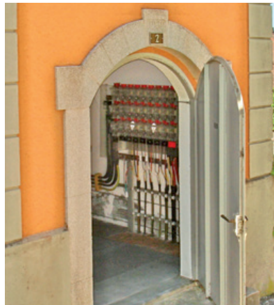
Links: Neuer Trafo Sonneflueh