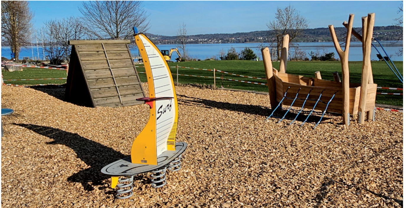
Der erneuerte Spielplatz in Wingreis.

Diesen Winter hat das Werkhof-Team den Spielplatz auf der Engelbergmatte in Wingreis erneuert mit 3 neuen Geräten zum Thema Wasser, Wind, Balance.