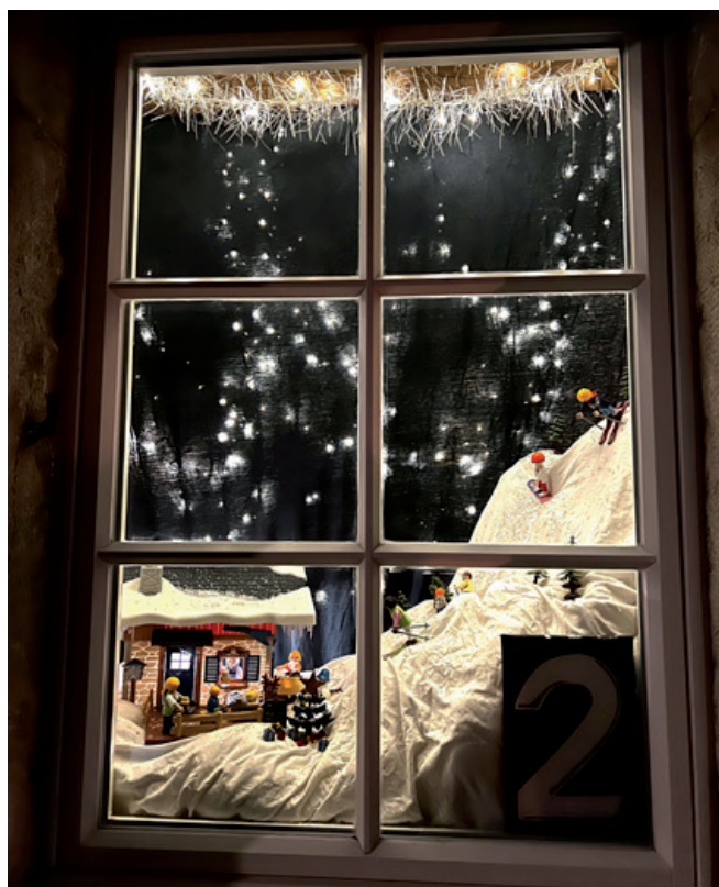
... Zum Beispiel: Adventsfenster ...

Frauenverein Twann, Dorfstraße 9, 2513 Twann frauenvereintwann@gmail.com