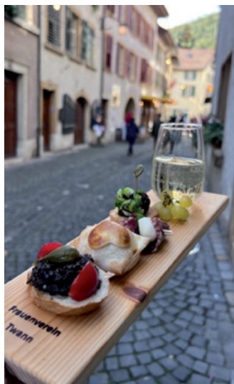
... oder die Trüetele, aber auch Ausflüge gehören ins Jahresprogramm des Frauenvereins.