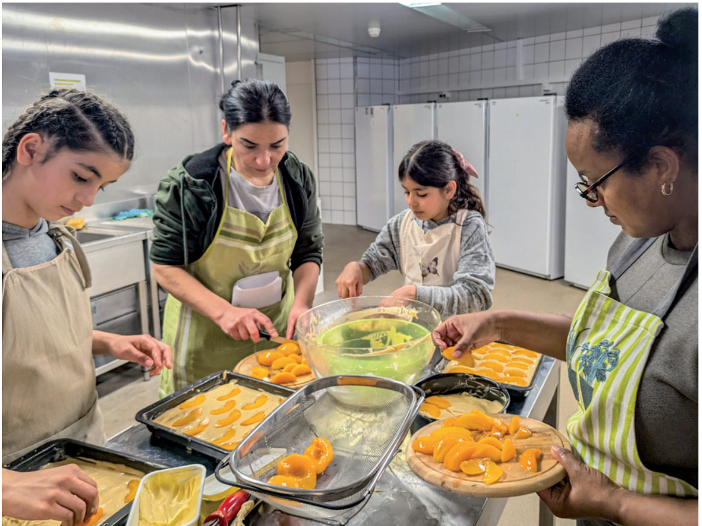
Geflüchtete Menschen backen gemeinsam Pfirsichkuchen.

In der Kollektivunterkunft auf dem Twannberg bringen Freiwillige regelmässig Abwechslung in den Alltag von geflüchteten Menschen. Ein Augenschein vor Ort.