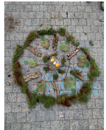
Von links: Nana-Ausstellung; Schatzkarte aus der Projektwoche; Mandala aus Quartalsstart